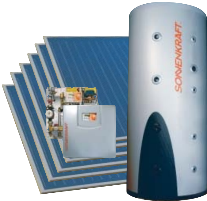
Abb.: COMFORT Heizungslösung mit PS1000i Schichtenspeicher Schichtlademodul. SK500 Kollektor mit strukturiertem Absorber.